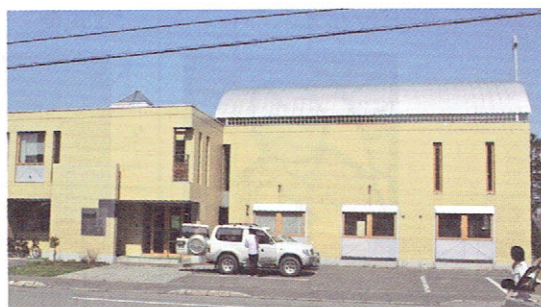
旭川教会会堂（1階の3つの2連窓に貼る）